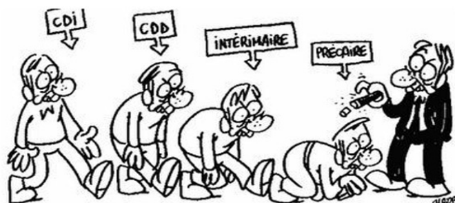
Et maintenant apprenti de 7 à 77 ans ?

Enfin, le CNESCO veut créer « un label entreprise formatrice » afin de « valoriser les entreprises qui s'engagent dans une réelle dynamique de formation des jeunes ». Là encore, l'apprentissage est favorisé au détriment de l'enseignement professionnel public. L'entreprise est une fois de plus idéalisée et appréhendée comme un lieu exempt d'organisation hiérarchique, de pression et de rapports de force. L'objectif d'une entreprise est la rentabilité en opposition avec les missions éducatives des établissements scolaires.